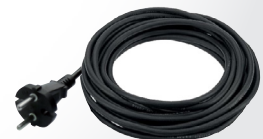
Câble 5 m résistant en caoutchouc Rubber 5 m power cord