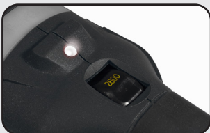
LED de surintensité moteur Overload LED light