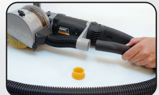
Collecteur de poussières déporté Dust collection