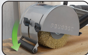
Rouleau d'appui frontal Front roll support